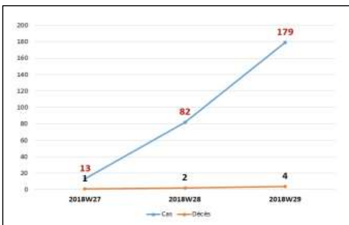
Fig. 1 : Tendence des cas et décès de choléra dans le District Sanitaire de Madarounfa (Niger), Semaine 27-29 2018 / Trend in cholera cases and deaths in the Health District of Madarounfa (Niger), Week 27-29 2018

Update on Epidemic-prone Diseases (EPD) in Week 29 (16 – 22/07/18)